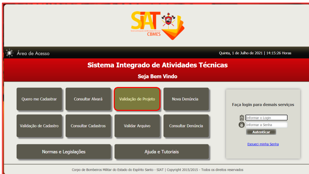
Figura 3 – Tela inicial do SIAT destacando o botão de Validação de Projeto.

Clicar no botão Validação de Projeto , como indicado na Figura 3.