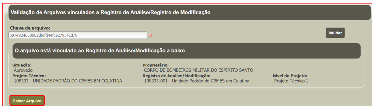
Figura 8 – Download do arquivo vinculado ao projeto.

Após verificar se os dados do projeto técnico são referentes ao arquivo vinculado desejado, clicar no botão Baixar Arquivo (Figura 8). O download do arquivo iniciará automaticamente.