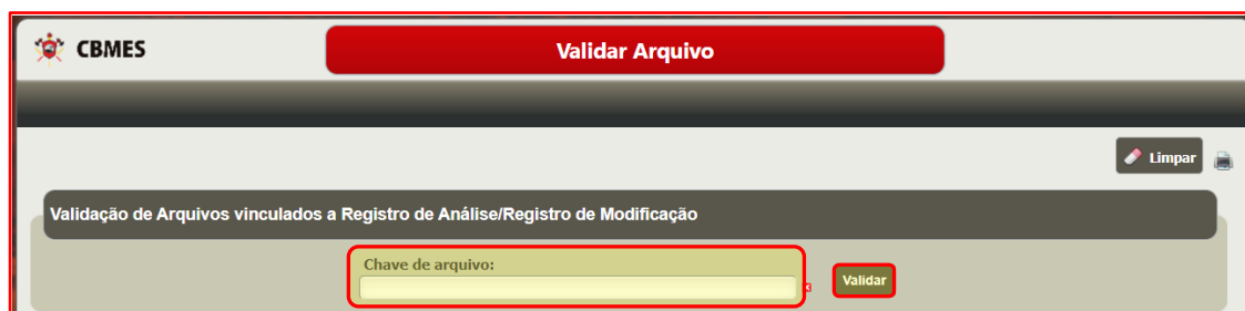
Figura 7 – Tela Validar Arquivo. Indica o campo para inserir a Chave de Arquivo do arquivo desejado.

Após verificar se os dados do projeto técnico são referentes ao arquivo vinculado desejado, clicar no botão Baixar Arquivo (Figura 8). O download do arquivo iniciará automaticamente.