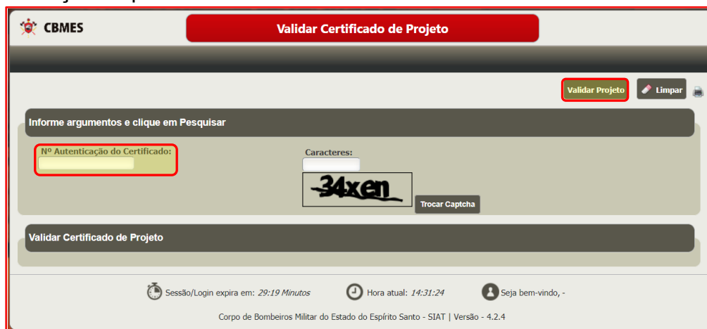
Figura 4 – Tela Validar Certificado de Projeto indicando o campo para inserir o Código de Validação do Certificado de Aprovação do Projeto.

Após inserir os caracteres Captcha clique em Validar Projeto e serão apresentados os dados do projeto para conferência, conforme mostrado na Figura 5.