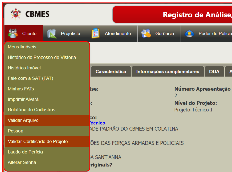
Figura 9 – Na aba “Cliente” é possível acessar as telas de validação do certificado do projeto e dos arquivos vinculados.

Também é possível validar o certificado de aprovação e os arquivos do projeto após estar logado no SIAT, acessando a aba Cliente e clicando nas opções Validar Certificado de Projeto ou Validar Arquivo , como mostrado na Figura 9.