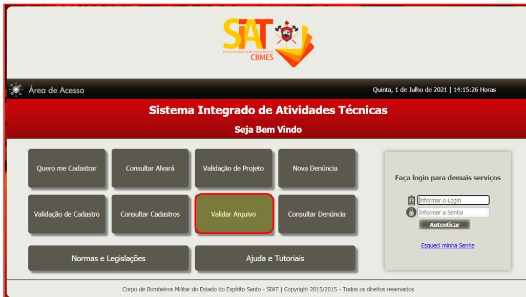
Figura 6 – Tela inicial do SIAT destacando o botão Validar Arquivo.

Clicar no botão Validar Arquivo , como indicado na Figura 6.