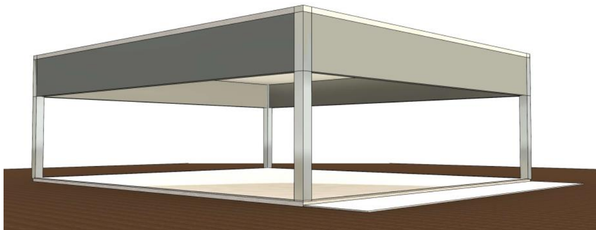
FIGURA 3 – Configuração de aberturas NÃO PERMITIDA por não atender o item 8.1 na íntegra. Nesta imagem, observa-se que, embora exista um percentual de aberturas superior a 50%, as mesmas estão dispostas nas partes inferiores das paredes. Como o acúmulo de fumaça ocorre nas partes superiores, tal configuração não favorece a dispersão da fumaça para fora deste ambiente coberto.